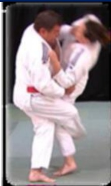
Ko Soto Gaki