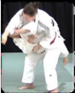
Sode Tsurikomi Goshi