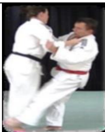
De Ashi Barai (Balayage du pied avancé)