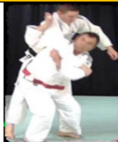
Ippon Soe Nage (Projection par-dessus l'épaule)