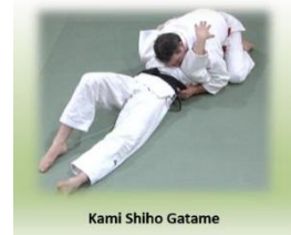
Kami Shiho Gatame

Kuzure Gesa Gatame ( Variante du contrôle par le travers)