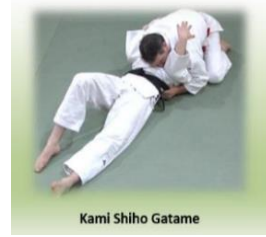
Kami Shiho Gatame

Tate Shiho Gatame (Contrôle des 4 points à cheval)