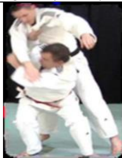
Morote Soe Nage (Projection d'épaule à deux mains)