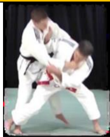
Tai Otoshi (Renversement du corps par barrage)