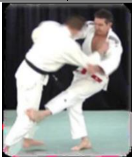
Hiza Guruma (Roue autour du genou)